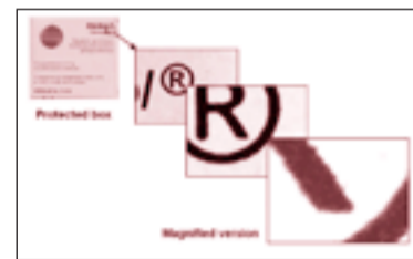
Emballage pharmaceutique protégé par Alpvision technology.

ALPVISION: Oui, mais pas énormément. Nous avons eu un business angel qui nous a fait confiance, comme déjà dit, nous avons été très rapidement rentables et nous avons donc pu nous payer un salaire. Il y a seulement eu un mois durant lequel nous avons manqué de cash, parce que deux clients ont payé en retard et que le capital de départ avait déjà été utilisé. Ce fut un moment assez désagréable.