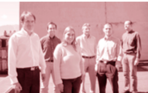
L'équipe de Alpvision.

ALPVISION: Prenons un exemple: nous pouvons imprimer un modèle constitué de points invisibles sur une feuille de papier et ensuite le détecter et l'identifier à nouveau à l'aide d'un scanner standard.