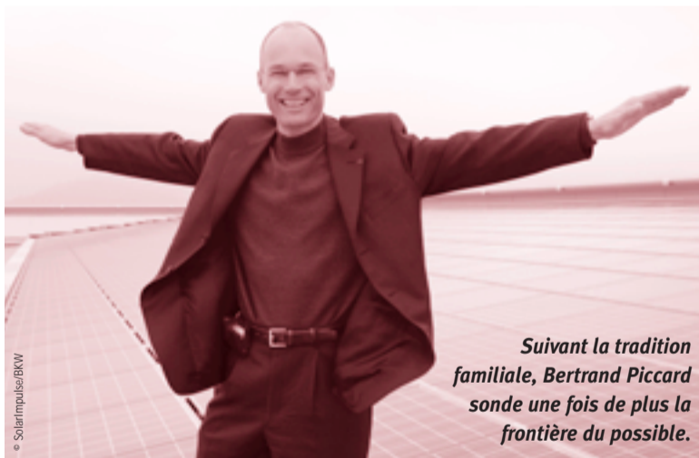
Suivant la tradition familiale, Bertrand Piccard sonde une fois de plus la frontière du possible.