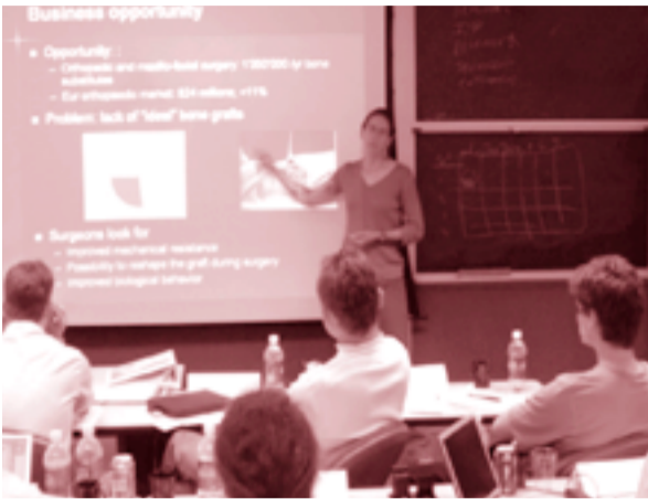
Win ten days of intensive entrepreneurship training in Boston (USA).

Get your top-class science onto the global market! Win the chance to participate in a unique 10-day program for high-potential entrepreneurs, including an entrepreneurship course, networking with venture capitalists and business opportunities in Boston (USA).