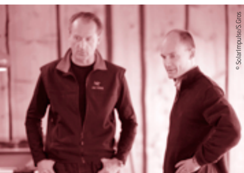
André Borschberg et Bertrand Piccard: les plus grandes performances entrepreneuriales sont toujours le fruit d'un travail d'équipe.

AB: De pouvoir combiner un vrai projet d'entrepreneur, avec, d'une part une aventure technologique dans cette nouvelle dimension des énergies renouvelables, et d'autre part une grande aventure humaine. Le rêve de tout pilote est de pouvoir faire le tour du monde... et quelle motivation que de pouvoir le faire accompagné du soleil!